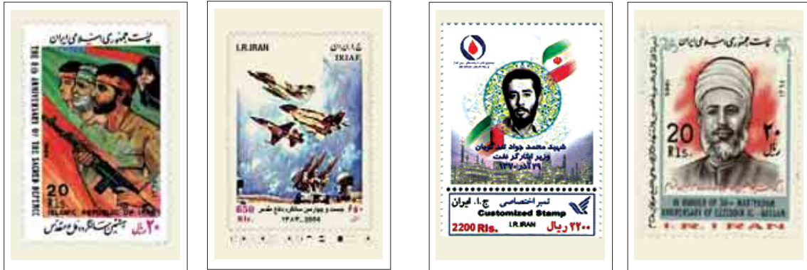
شکل ۷: جنگ تحمیلی و دفاع مقدس موضوع دیگری از تمبرهای پس از انقلاب است.

پیشگامان انقلاب اسلامی و شهدای جنگ تحمیلی و شهیدان نهضت‌های اسلامی سایر کشورها. (شکل ۶)