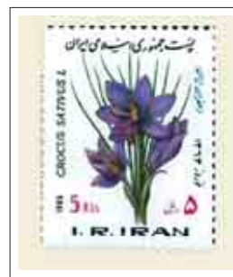
شکل ۹: تمبرهایی با موضوعات فرهنگی که نماد هویت ایرانی می‌باشند، یکی از موضوعات تمبرهای پس از انقلاب است.