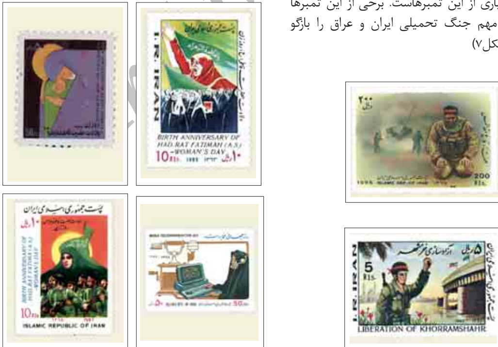
شکل ۸: نمونه تمبرهایی با موضوع زن و حضور او در جامعه، موضوع دیگری از تمبرهای پس از انقلاب است.

جنگ تحمیلی و دفاع مقدس و پیامدهای آن نیز موضوع بسیاری از این تمبرهاست. برخی از این تمبرها رویدادهای مهم جنگ تحمیلی ایران و عراق را بازگو می‌کنند. (شکل ۷)