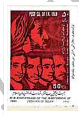
شکل ۶: موضوع شهادت، یکی از موضوعات تمبرهای پس از انقلاب است.

موضوع مهم دیگری که نقش تمبرهای این دوران را تشکیل می‌دهد، حضور زن در عرصه اجتماع، با ارزش‌های اسلامی می‌باشد که در دوران‌های شاهنشاهی قبلی این نقش در جامعه بسیار کم‌رنگ و در حاشیه است. اگر هم، زنی بر تمبرهای شاهنشاهی نقش تمبر شده است، از زنان خاندان شاهنشاهی و وابسته به حکومت و شاه می‌باشند و زن متعلق به جامعه در تمبرهای شاهنشاهی و قاجاریه جایگاهی ندارد. (شکل ۸)