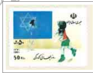
شکل ۱۱: تمبر پرمراجاری روز جهانی کودک، ۱۳۷۰

این رابطه طراحی می‌شد و هر وقت اسم کودکان به میان می‌آمد، ناخودآگاه این تصاویر را به ذهن متبادر می‌ساخت. قلم را برداشتم و طرح کودکی که با سنگ، شیشه‌ای که نشان صهیونیسم بر آن بود را شکسته بود، تصویر کردم. تمبر به تأیید شورای تمبر رسید و به تیراژ سه میلیون در تاریخ ششم آبان ماه یکهزار و سیصد و هفتاد شمسی منتشر شد و بر روی پاکت‌ها و مرسولات پستی رفت. پس از مدتی از سوی مقامات با من تماس گرفته شد تا در جلسه‌ای مهم و اضطراری شرکت کنم. در این جلسه عنوان شد که بنا به دلایل سیاسی، مرسولات و نامه‌هایی که با تمبر من به کشورهای خارجی ارسال شده‌اند، همگی برگشت خورده‌اند و هیچ یک از آن‌ها به دست گیرنده‌ها نرسیده‌اند و به این ترتیب خشم کشورهای غربی را برافروخته است و منجر به اعتراض کشورهای عضو اتحادیه جهانی پست شده است." (صادقی، ۱۳۹۱) در واقع این داستان مستند تاریخی، اهمیت و حساسیت تمبر و نقش پیام‌رسانی سندی را نشان می‌دهد که به عنوان نماینده و سفیر یک کشور، افکار، هویت و فرهنگ مردم آن کشور را به سایر ملل و بدون هیچ‌گونه واسطه‌ای معرفی می‌کند و می‌تواند یکی از روش‌های تبادل اطلاعات بین کشورها و جوامع مختلف محسوب شود.