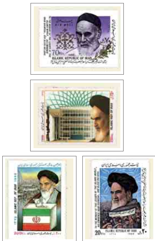
شکل ۱۰: تصویر بنیانگذار انقلاب اسلامی بر تمبرهای پس از انقلاب

یکی دیگر از تصاویری را که بر تمبرهای این دوران، مخصوصاً دهه اول پس از انقلاب، به وفور می‌بینیم، تصویر بنیان‌گذار و رهبر انقلاب اسلامی ایران است که تأثیرگذارترین چهره در پیروزی انقلاب و به نوعی، سمبل مبارزات و انقلاب اسلامی ایران محسوب می‌شود. (شکل ۱۰)