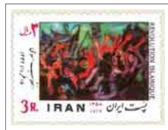
شکل ۱: نمونه تمبرهای پس از انقلاب، ۱۳۵۸