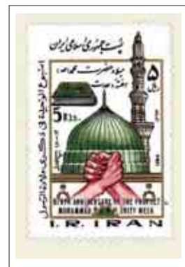
شکل ۴: تمبر هفته وحدت (۱۳۶۲) و عید فطر (۱۳۶۴)

بر تمبرهای پس از انقلاب، موضوع شهادت، به صورت گوناگون تصویر شده است؛ از جمله تمبرهای بزرگداشت