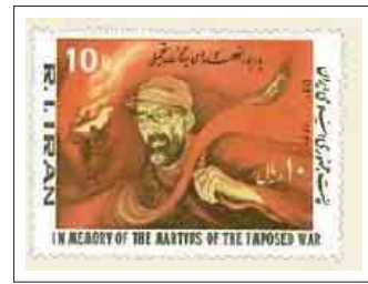
شکل ۲: برخی تمبرهای پس از انقلاب، تصاویری از پیشگامان انقلاب را در خود دارد

خصوص کشورهایی که ارزش های مشترکی با اهداف انقلاب اسلامی ایران دارند نیز خبر می‌دهد. حمایت از جنبش‌های اسلامی دیگر کشورها، همچون انتفاضه فلسطین و قیام مردم افغانستان، در این میان جایگاهی خاص دارند. (شکل ۵)