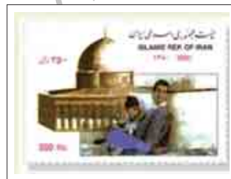
شکل ۵: حمایت از جنبش‌های اسلامی دیگر کشورها، همچون انتفاضه فلسطین و قیام مردم افغانستان

یکی دیگر از تحولات مهم نقوش تمبرهای پس از انقلاب، تغییر یافتن نقش مایه تمبرهای این دوران است که در دوران قاجار، تصویر شیر و خورشید و در دوره پهلوی، عبارت «دولت شاهنشاهی ایران» بود. در اردیبهشت ۱۳۶۰ به عبارت «پست جمهوری اسلامی ایران» تغییر یافت. پس از انقلاب به جای تمبرهای ویژه جشن‌های ۲۵۰۰ ساله یا تاجگذاری، تمبرهایی به مناسبت اعیاد و مناسبت‌های مذهبی چاپ شد. تمبرهای ویژه هفته وحدت نیز به منظور همبستگی میان مذاهب اسلامی بارها به چاپ رسید. (شکل ۴)