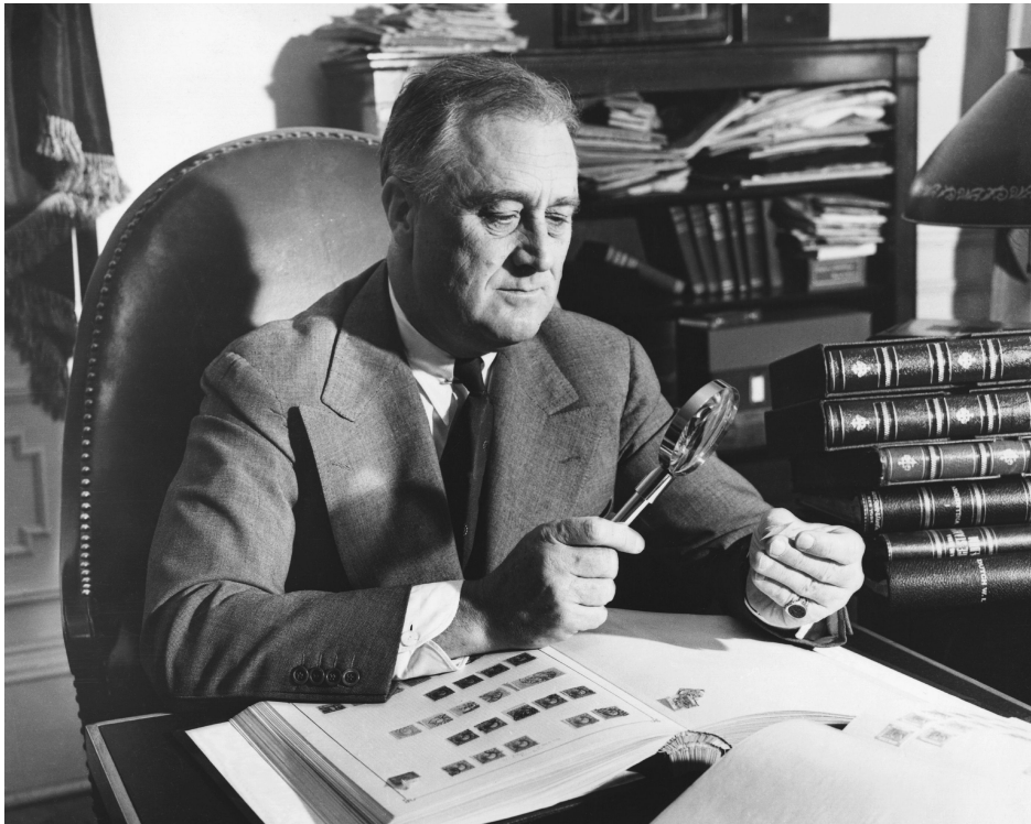
فرانکلین دلانو روزولت